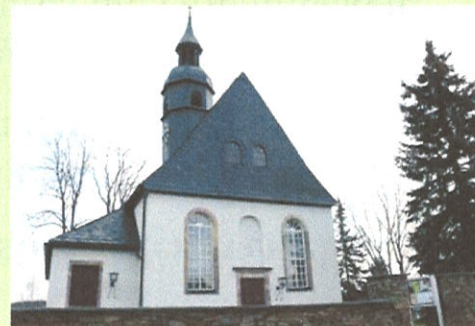
Evangelisch-Lutherische Kirchgemeinde Zwönitz (Gemeindeteil Brünlos)