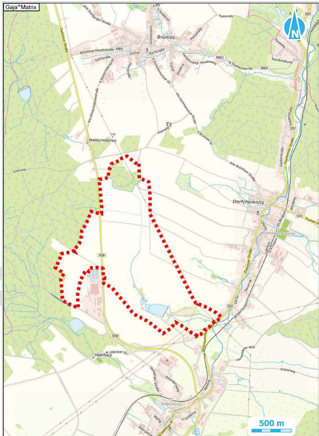
Übersichtsplan zum räumlichen Geltungsbereich der Veränderungssperre (nicht rechtsverbindlich, nur zur Orientierung)

Ist eine Verletzung nach § 4 Abs. 4 Satz 2 Nr. 3 oder 4 SächsGemO geltend gemacht worden, so kann auch nach Ablauf der in § 4 Abs. 4 Satz 1 SächsGemO genannten Frist jedermann diese Verletzung geltend machen.